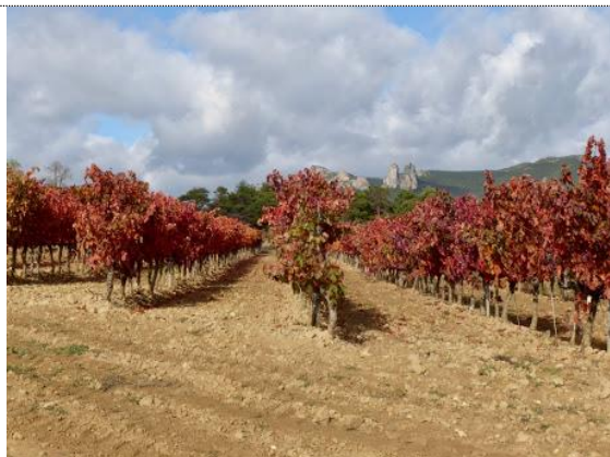
Vinmark i efterårsfarve, Rioja

Se foto fra Midt - & Sydfrankrig (14 – 26.10.2019)