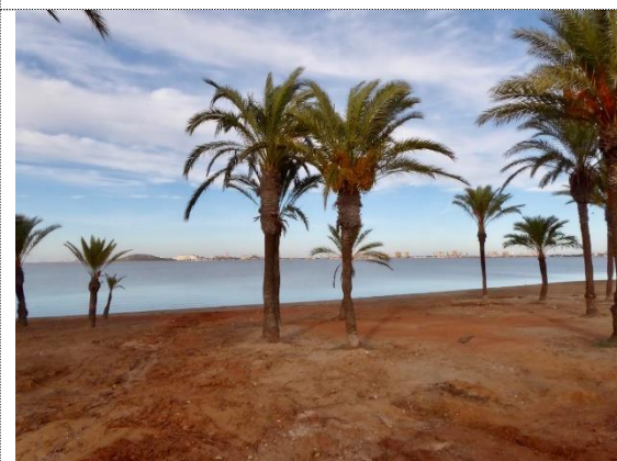
Lagunen Mar Menor, La Manga

Se video med tusindvis af flyvende flamingoer