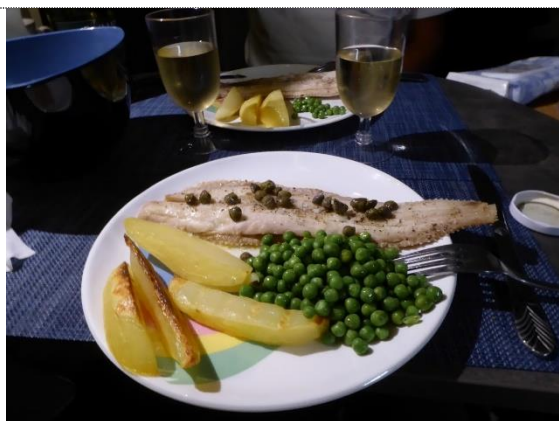
Søtunge nydes i Camperen

Se foto fra Nordspanien og Rioja (28.10 – 02.11.2019)