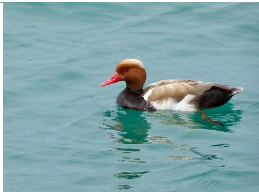
Sjælden ederfugl i Lazise