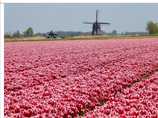
Tulipanmark ved Anna Paulowa

Se foto fra De Potten og Afsluitdijk (24 - 25.04.2019)