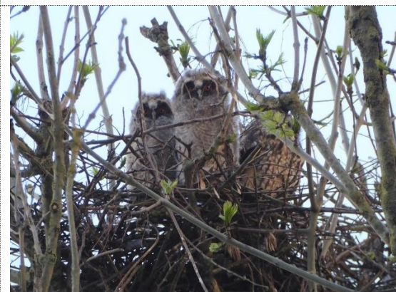
Hornugle med sine unger