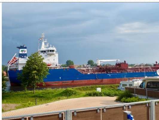
Rendsburg, trafik på floden