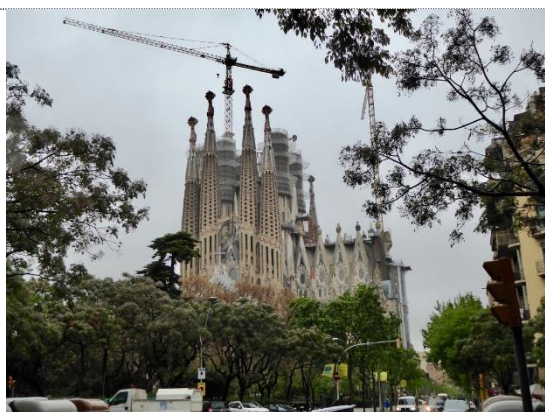
La Sagrada Familia, Barcelona

Se foto fra Sydfrankrig (27.04 – 0.2.05-2019)