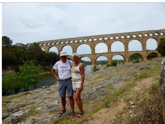
Broen "Pont du Gard"

Se foto fra Costa Brava og Dali museet (05 – 16.5.2019)