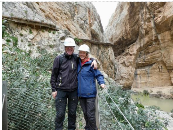
Vandretur på Caminito del Ray

Oplevelser fra et liv uden planer og hvor vejrguderne & Covid-19 er vores vejviser