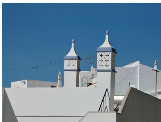
Anderledes og farverig skorsten i Portugal

Se foto fra Sydspanien (Atlanterhavskysten) (25.2 – 02.03.2020)