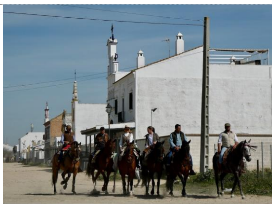
El Rocio – byen kun med sandgader

Se foto fra Sydspanien (Malagaområdet) (19 – 24.02.2020)