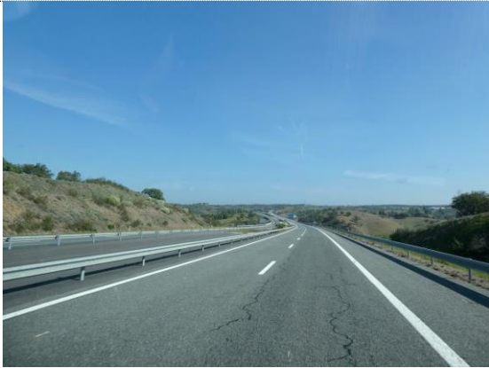
Tomme vej på vej hjem mod DK

Oplevelser fra et liv uden planer og hvor vejrguderne & Covid-19 er vores vejviser