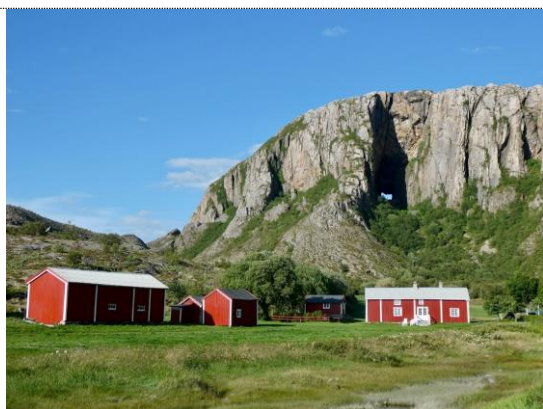
Torghatten (Naturens katedral)

Se fotos fra Finmarken og Nordkap (13 – 21.07.2020)