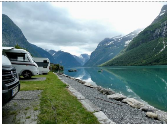
Vores overnatningssted ved Loen