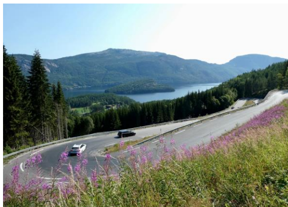
En af de mange hårnålesving